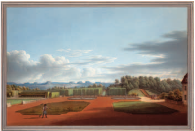
Blick von der Gartenanlage in Großsedlitz auf die Sächsische Schweiz Christian Gottlob Hammer, 1821, Gouache